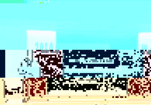
教育学院2010年度学术交流会会场一角

教育学院2010年度学术交流会，旨在进一步密切与兄弟院校的交流与合作，提升教育学院学术影响力。会议吸引了来自国内外的专家学者，围绕教育理论、实践案例等方面进行了深入的探讨。会议期间，与会代表围绕“教育国际化背景下的教师发展”等主题开展了热烈的讨论，并达成了多项合作意向。此次交流会的成功举办，为教育学院今后的学术发展注入了新的动力。